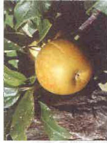
Perava ou Perrasse dérivé de pomme-poire

La protection des rivages se conjugue aussi avec la restauration d'activités traditionnelles : création d'un verger à Abbadia, pisciculture sur le domaine de Certes en Gironde, marais salants sur l'île de Ré ; ailleurs, plantation de vigne ou élevage extensif de bovins ou de brebis... La recherche de la richesse écologique et de la qualité des paysages peut ainsi contribuer au développement d'activités économiques et à la création d'emplois. Le domaine d'Abbadia était particulièrement adapté à recevoir un verger de collection ; la protection et la mise en valeur du littoral et celles des variétés fruitières rustiques locales participent de la même logique ; et au Pays basque, l'histoire de la pomme a souvent croisé celle des rivages.