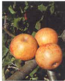
Udarr sagarra, Anika Rosalia, Pomme d'Anis

La recherche, la conservation et la valorisation du patrimoine agricole local sont plus que jamais une nécessité : ces plantes, rarement bien étudiées, bien souvent renommées malgré une aire de répartition parfois fort limitée, présentent en effet des capacités d'adaptation à la région où elles ont été cultivées pendant de nombreuses générations, ainsi que des caractères de rusticité, de résistance à certaines maladies, de saveur, qui en font une banque de gènes pour demain et... le délice des gourmets !