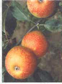
Cabana sagarra la belle reinette à chair croquante

Le verger d'Abbadia est une prairie plantée d'arbres. Ce n'est pour autant ni réellement une prairie, ni un bois. C'est un milieu différent, spécifique. Dès la plantation des arbres, un engrais vert – composé de légumineuses (trèfle blanc, trèfle violet et hybride, lotier, luzerne) et de graminées ( rizy-grass anglais et italien, fléole, fétuque, dactyle) – a été ensemencé. La prairie qui en résulte ajoute à l'attrait du verger ; de plus, elle ralentit l'érosion d'un sol en pente. Enfin, la fauche et l'enfouissement périodique par moitié de cet engrais vert permet de ralentir le lessivage des matières minérales, tout en enrichissant le sol en matière organique et en matières azotées. Les premières cueillettes de Jinko sagarra , Gordin xuria , Ragaou ou Carabille datent du début des années 1990.