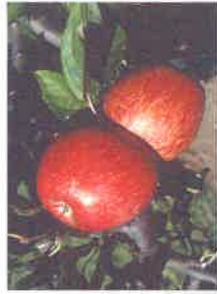
Entzea sagarra , grosse pomme aplatie, mûrissant en fin d'automne

Peut-être aurez-vous une préférence pour Burdinga d'hiver , ou le Museau de lièvre rouge ? Pour les cerises, vous avez le choix entre Pelua d'Ixassou , Markixia gezia , Xapata , Mourette ou tant d'autres. Des stages de greffage sont organisés depuis 1980 en Aquitaine et depuis 1989 à Abbadia ; on peut également acheter des plants ou participer à des stages de taille . Ils permettent aux amateurs de réimplanter chez eux toutes ces variétés : leur diversité et leur caractère typique assurent de cultiver chez soi des fruits aux goûts si différents.