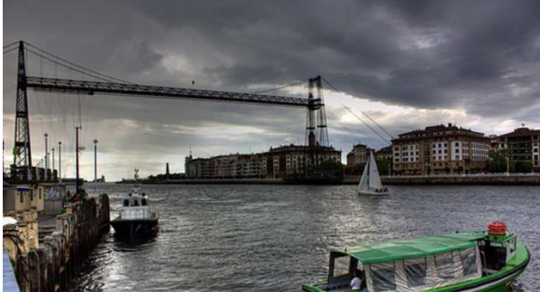
Vista a fondo del Puente de Portugalete.

TEMAS > COSTA-VASCA (/TAGS/COSTA-VASCA) | TXAKOLÍ (/TAGS/TXAKOLÍ%3C%AD) | RÍA-DE-BILBAO (/TAGS/RÍ%3C%ADA-DE-BILBAO)