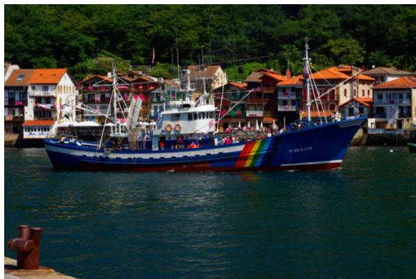
Barco museo Mater (Pasaia).

La Ferrería ofrecerá también una demostración completa con la puesta en marcha del martillo pilón y exhibición de forja tradicional en la fragua.