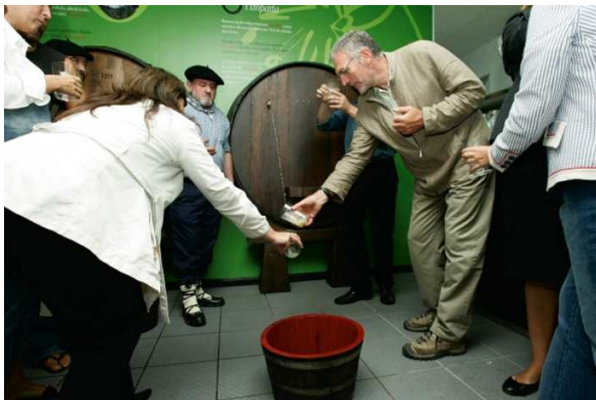
Degustación y cata en el museo

El programa de este Mes de los Museos incluye más de 100 actividades, como talleres, visitas guiadas especiales, etcétera; además de numerosas ventajas y descuentos. Así, el Museo Sagardoetxea de la Sidra Vasca (Astigarraga), realizará una visita guiada interactiva a través de la exposición Marineros en Sagardoetxea, a lo largo de la cual se explicará la importancia que ha tenido la sidra entre los marineros vascos.