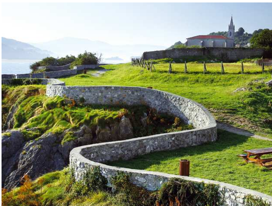
Los mejores maridajes de Euskadi

Productos vascos, de calidad. En Euskadi el mar y la tierra han sido generosos con sus materias. El Cantábrico aporta a la gastronomía vasca productos verdaderamente exquisitos y tierra adentro su origen garantiza una calidad extraordinaria, reconocida además por un distintivo propio: Eusko Label. Descubre, como han hecho recientemente los prestigiosos World Cheese Awards, los quesos vascos, pero también los productos de la huerta: los pimientos, las alubias, las guindillas, la patata alavesa, la lechuga y el tomate del país.