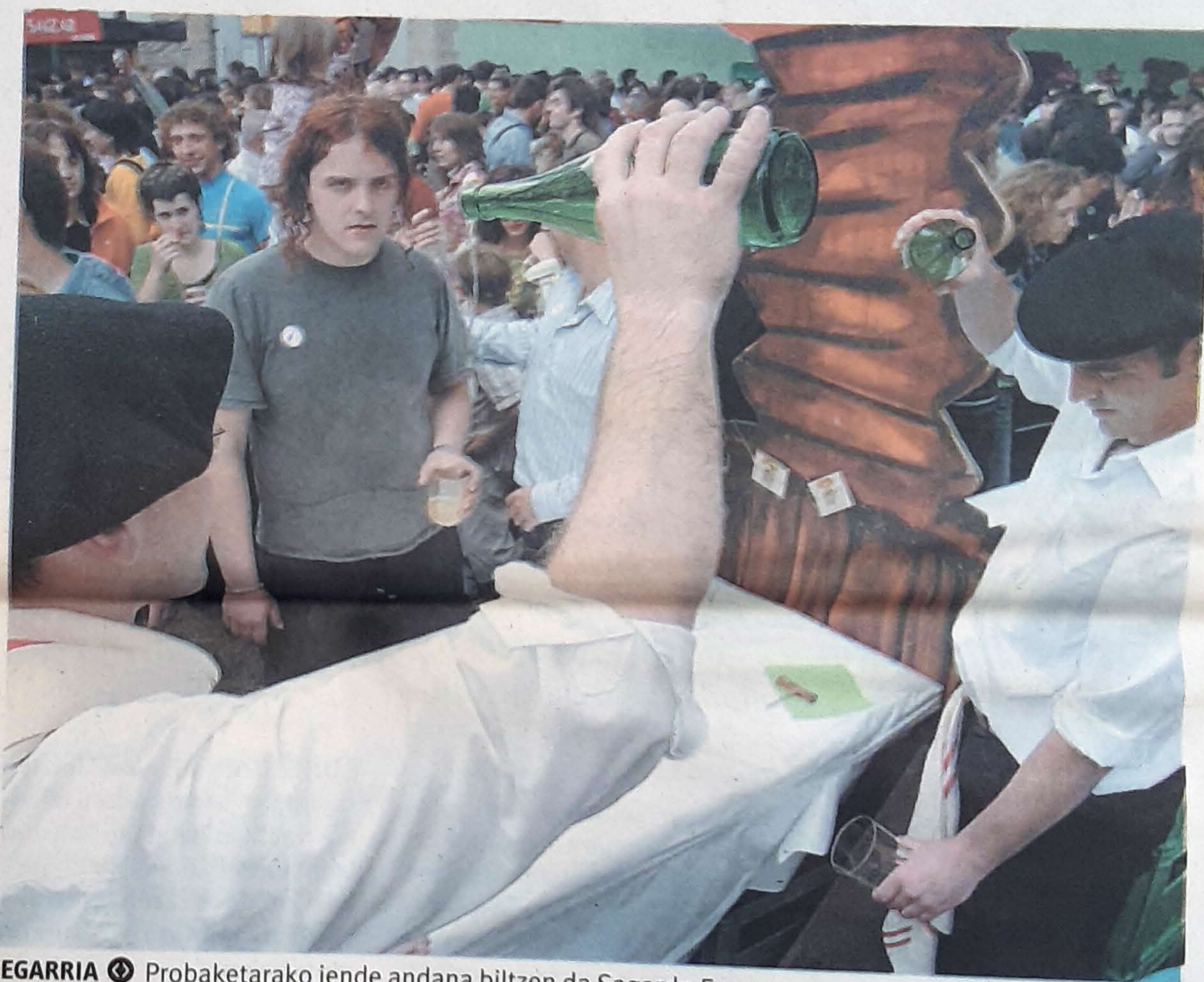
EGARRIA ☉ Probaketarako jende andana biltzen da Sagardo Egunean.