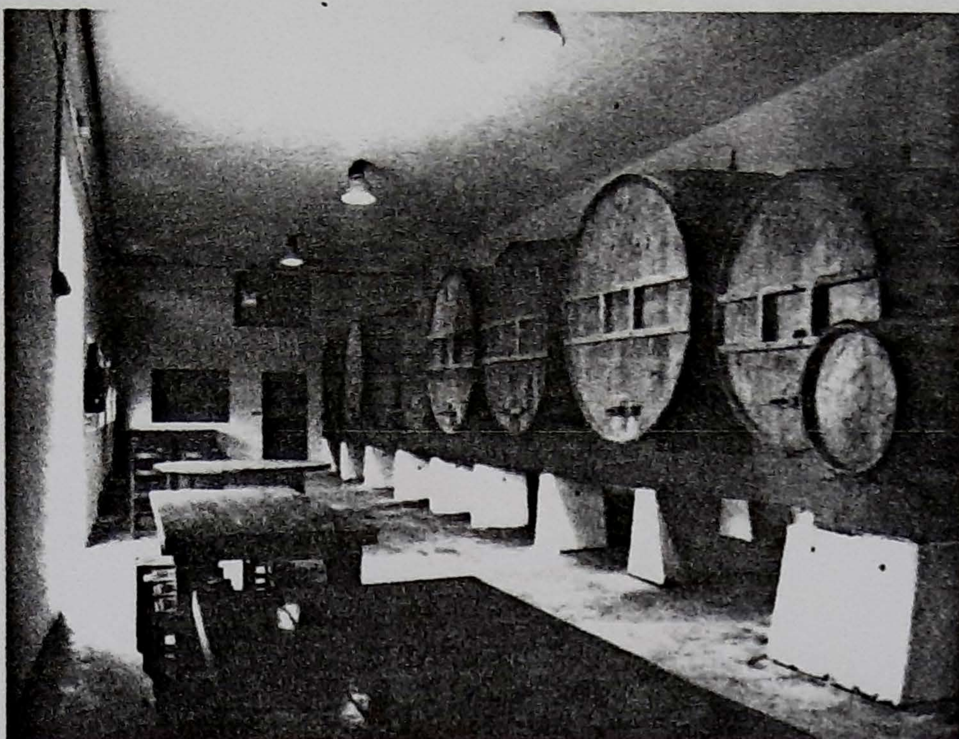
■ Euskal Herrian sagardo naturala edaten da eta atzerrian gasifikatua, atxanpanatua.

Bestalde, Euskal Herriko eta Asturiasko sagardoak botilan bakarrik saltzen dira. Txotx garaia Euskal Herriko ohitura da eta Asturiasen ez dute egiten. Gauza bera gertatzen da sagardo ekoizle diren gainerako herrialdeetan. Sagardoa ez da sagardotegietan edaten eta botila ez da edaria saltzeko erabiltzen duten ontzi bakarra. Botilak tamaina desberdinetakoak izaten dira, edale bakar bati zuzenduak gehienetan. Botila hauek tabernetan saltzen dira batez ere. Espainian ez bezala sagardoa enlatatu egiten da Estatu Batuak, Kanada eta Finlandia aldean. Supermerkatu eta dendetan hala saltzen da sagardoa, garagardoa bailitzan. Gure moduko botilak jatetxe eta halakoe-tan saltzeko besterik ez dira egiten.