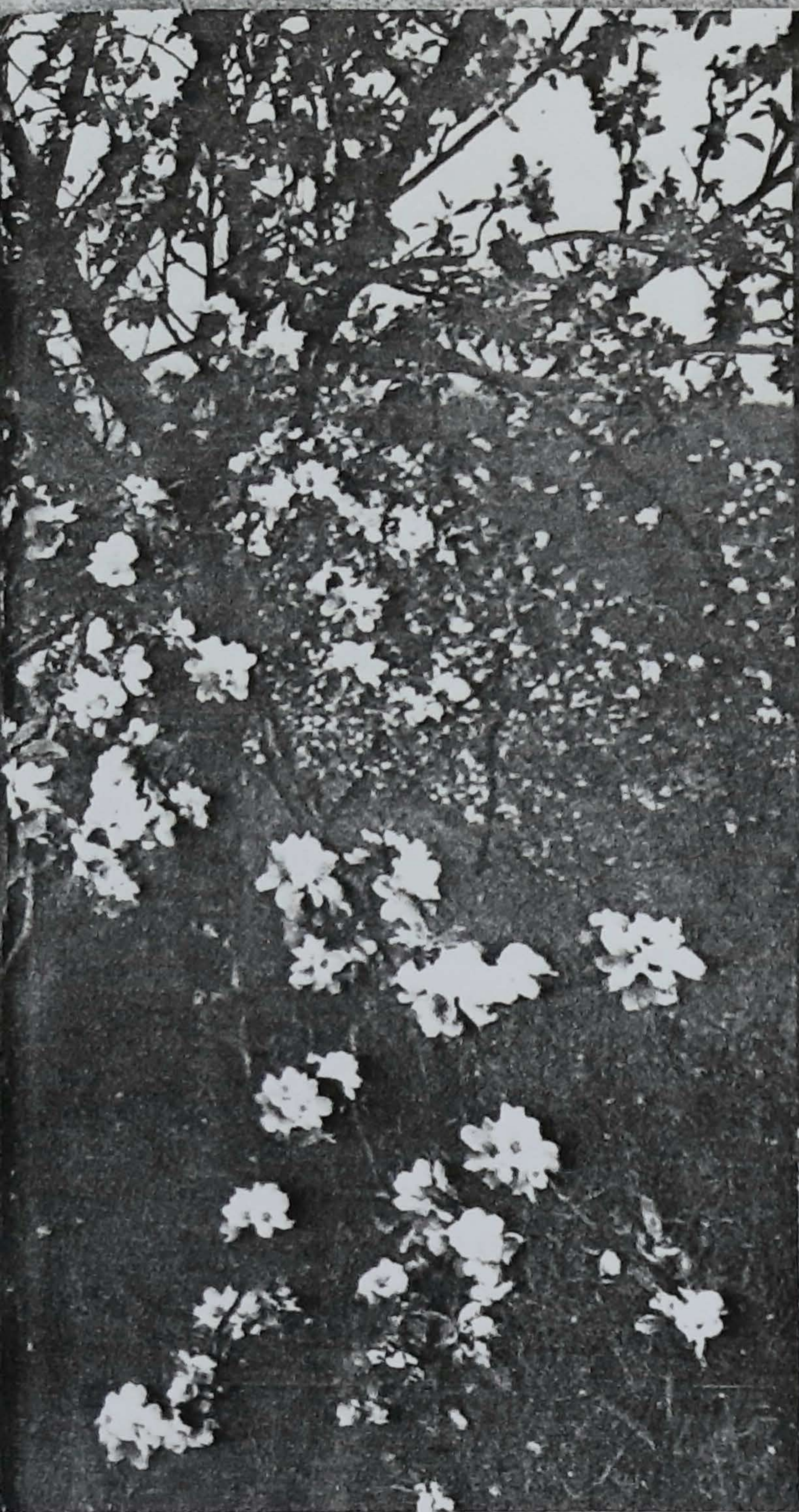
nuak sagarrondoak bultzatzen ditu; daude eta Frantzian 18 milioi.