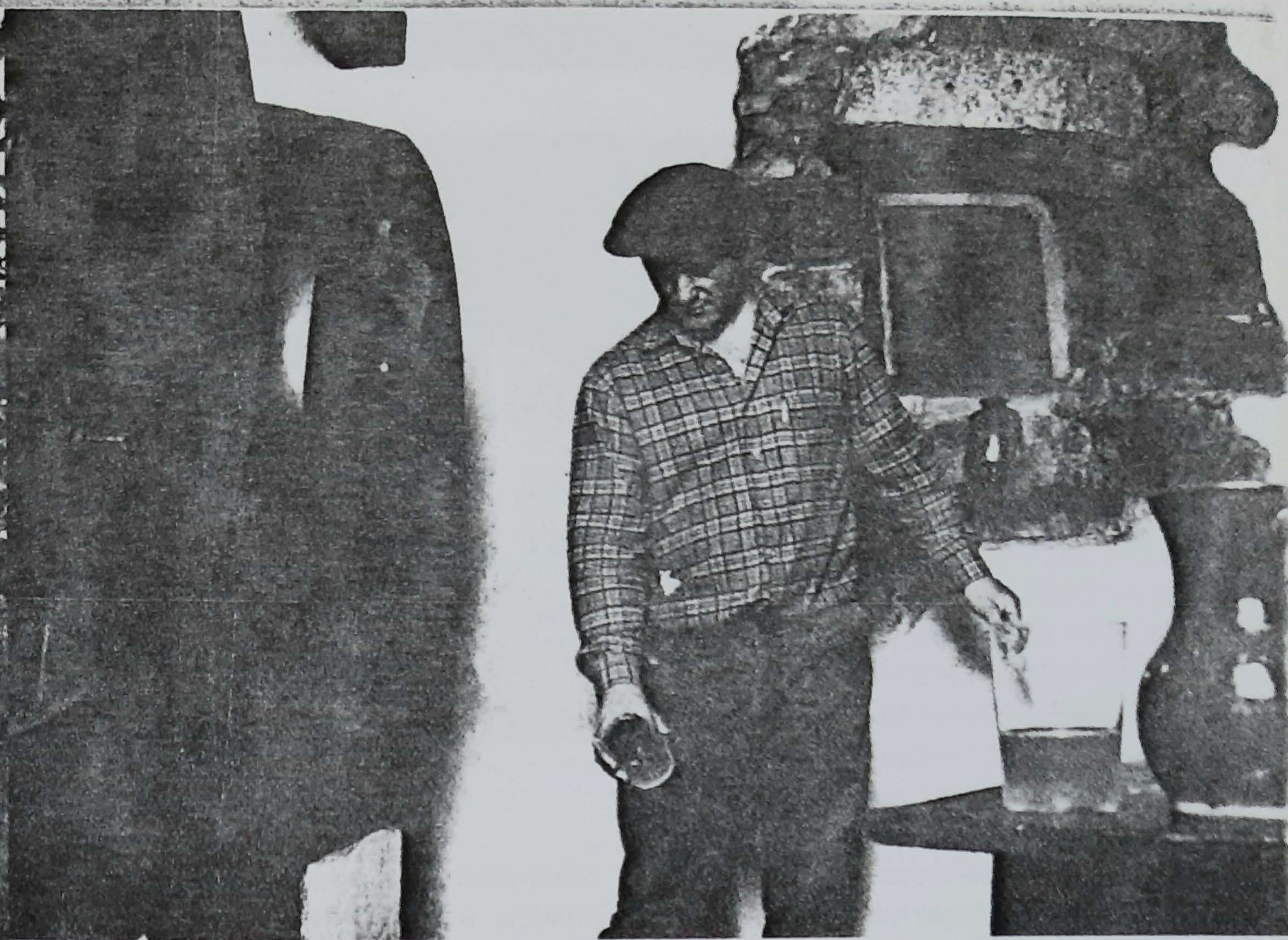
Txotxean edatea hemengo ohitura da, atzerrian latetan saltzen da sagardoa.

upel edaten zen laguneko Massachusetts-eko estatuan eta Harvard-eko ikasleek eguneroko dietaren barruan zuten. Estatu Batuetako lehen hiru presidentek, George Washington, John Adams eta Thomas Jefferson, sagardo edale amorratuak izan ziren. William Henry Harrison-ek (1840), adibidez, sagardo upel baten logotipoa erabili zuen bere lehendakaritza kanpainarako.