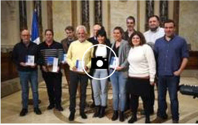
📷 Homenaje a las compañías más antiguas