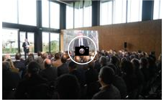
📷 Las mejores imágenes de la inauguración de Fabrika