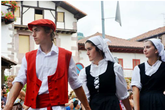
( http://www.argia.eus/albisteaz/dokumentuaren-akzioak-euskal-dantza-baztertu-du-berriz-etxeparek )

Hauts-de-Sainte-Croix auzoko enpresa baten gas biltegian gertatu da leherketa eta bi hildako eta gutxienez hiru zauritu utzi ditu.