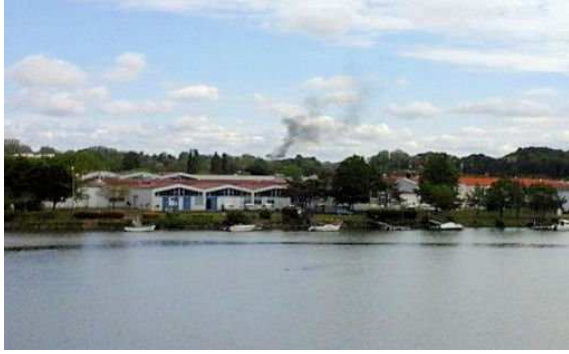
( http://www.argia.eus/albisteaz/eztanda-handia-izan-da-baionan-enpresa-batean )

2016-05-12 | ARGIA ( http://www.argia.eus/argia-astekaria/egileak/argia )