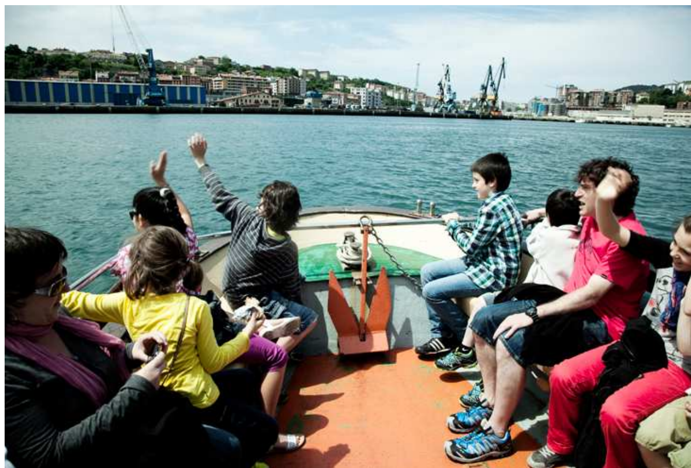
La sidra y el mar.