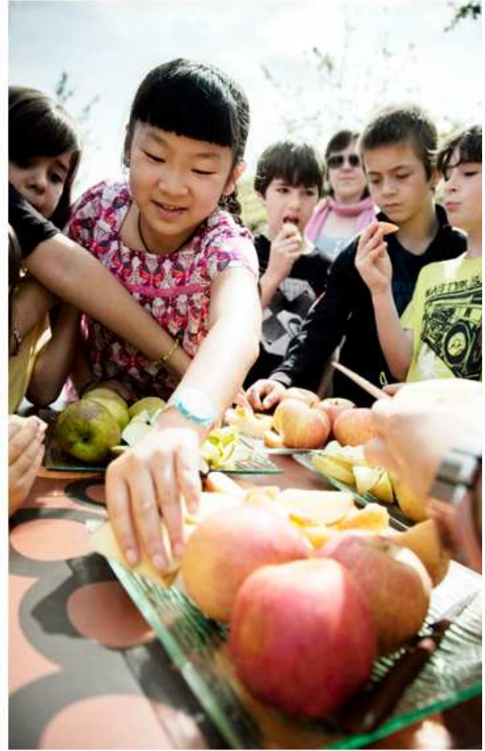
Sidrero por un día. Fotografías de Sagardoetxea

1. Manzanal: El manzanal museístico es un espacio al aire libre donde apreciar de una forma dinámica y pedagógica la cultura de la manzana. Aquí se desarrollan diversas actividades demostrativas, enseñanzas, injertos y cultivos acercando al visitante al fascinante mundo de la naturaleza en un contexto ameno y divertido.