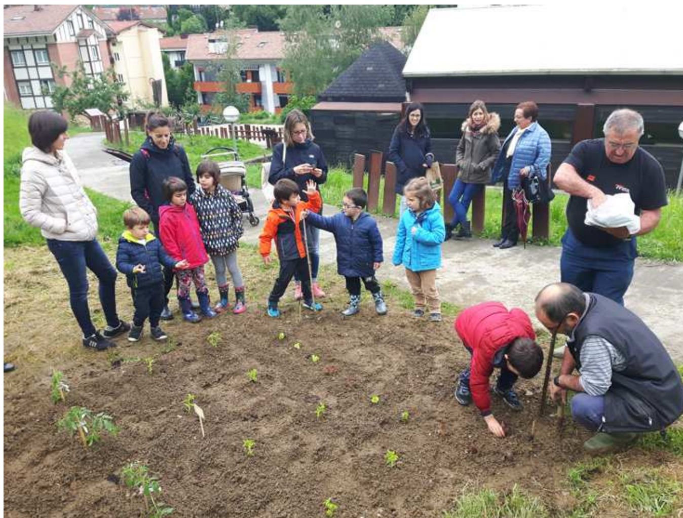
Fotografía de Sagardoetxea