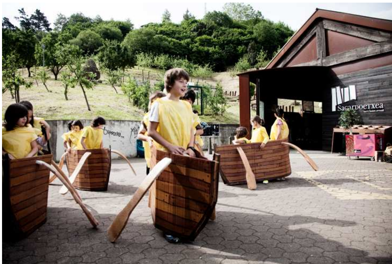
fotografía de sagardoetxea

En Astigarra cuna de la sidra por excelencia de la provincia se encuentra el Museo de la Sidra o Sagardoetxea.