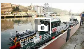
■ Nueva patrullera en Pasaia