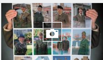
■ Mujeres con Valor 2019, el calendario del Ejército de Tierra