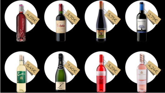
15 chollos de la sección de vinos del supermercado