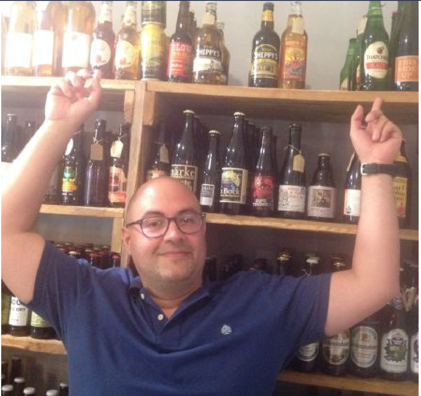
La tienda Sr. Lúpulo, situada en el centro de Gijón, cuenta con una de las colecciones de sidras de importación más variadas de España.

P ¿Qué supone para el sector de la sidra un lanzamiento tan sonado como el de Ladrón de Manzanas?