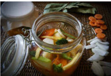
Conserva de verduras de invierno en escabeche suave