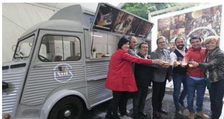
Presentación del 'Cider Truck'

El 'Cider Truck', un vehículo que simula una sidrería itinerante, es el elemento central de una campaña de promoción turística que dará a conocer, en varias ciudades de Francia y España, la singularidad de la temporada del txotx de Gipuzkoa.