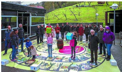
Divertido y participativo juego de la oca de Sagardoetxea.