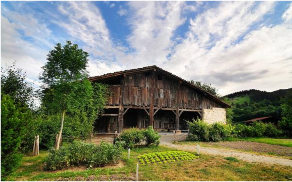
Museo caserío de Igartubeiti en Ezkio Itsaso.