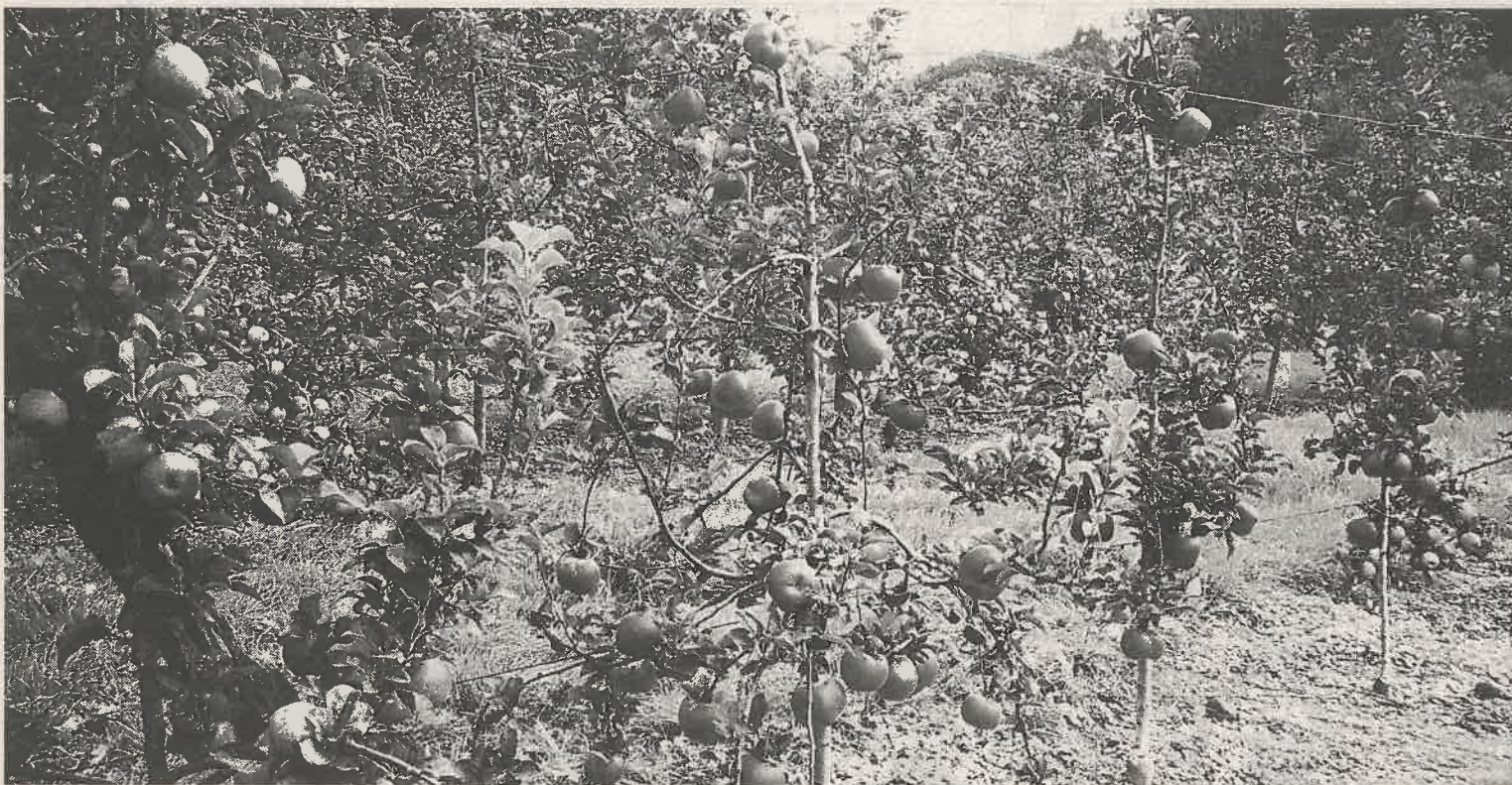
Sagar asko izango da aurtengoan, irudian agertzen den moduan. [IÑIGO GOÑI]