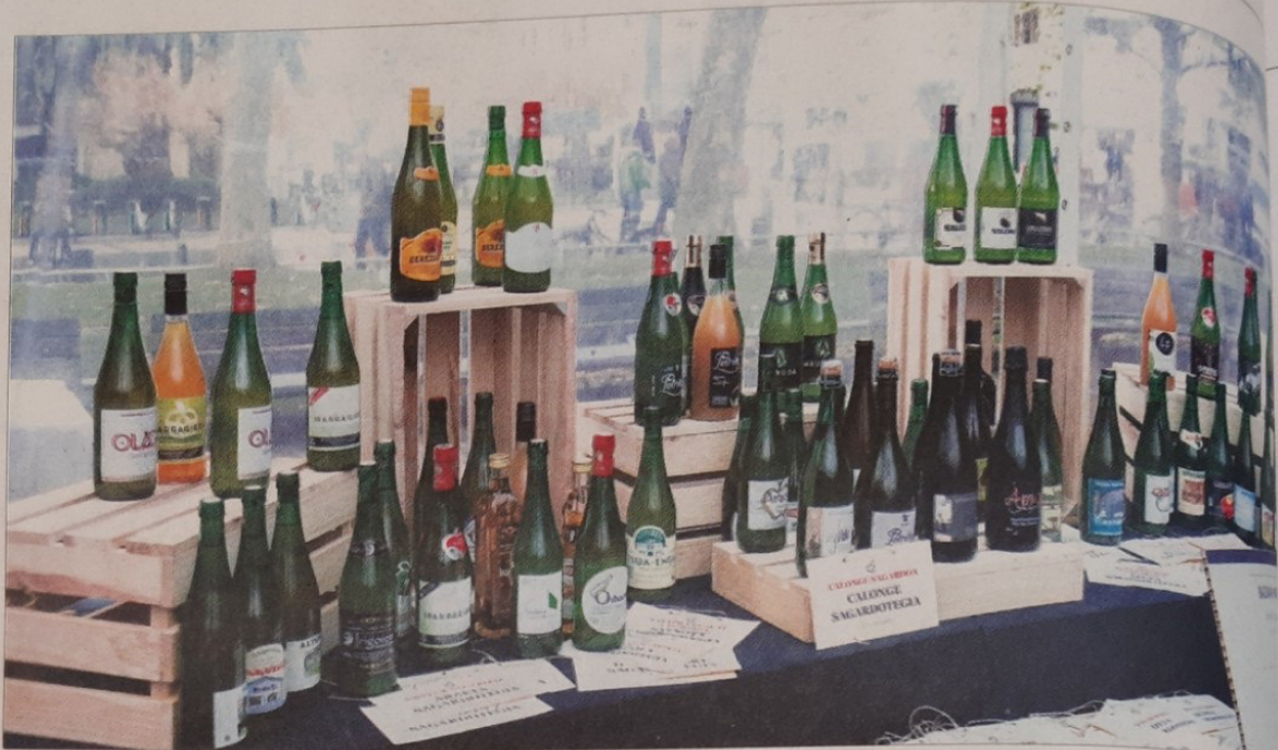
Txotx denboraldia bukatuta, botilako sagardoaren eskaintza zabala dago merkatuan.