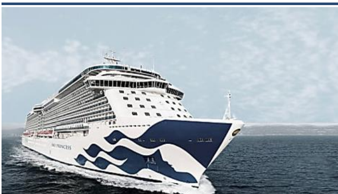
Schiff Ahoi! Warum... Primepulse Magazine