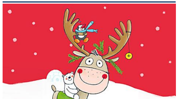
Jetzt bis zu 25%... Jako-O