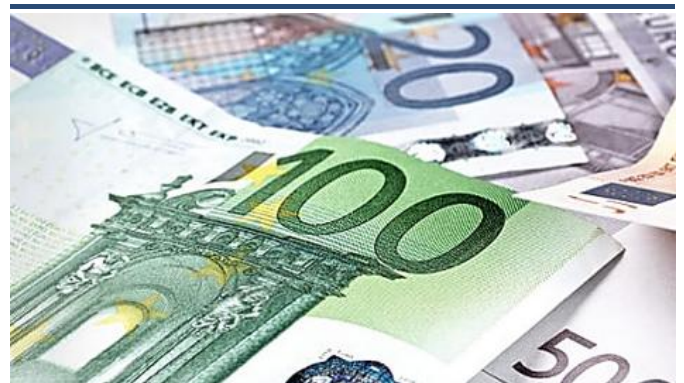
Dieser Kreditvergleich begeistert... Finanzcheck