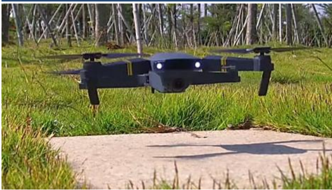
Este barato drone... Prime Life Tips