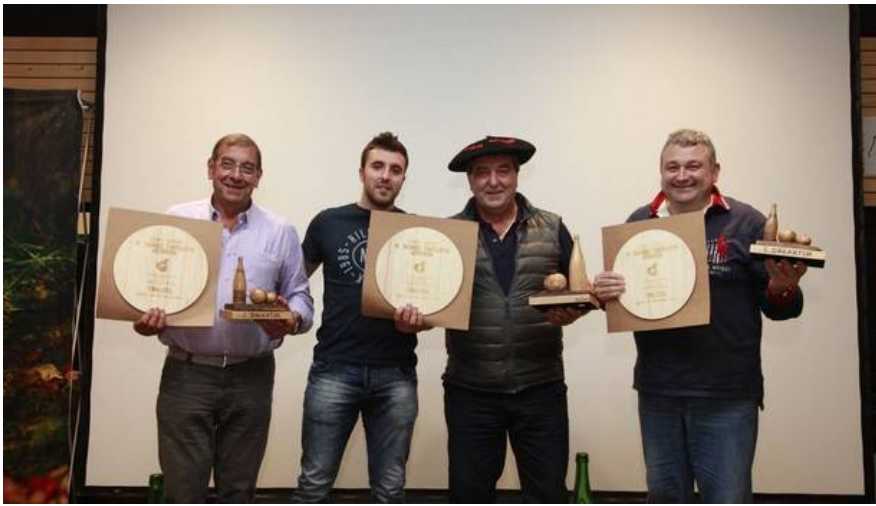
Representantes de las sidrerías vencedoras. (N.G.)

DONOSTIA- La sidrería Gaztañaga de Andoain obtuvo el primer premio en el III Concurso Popular de Sidras de Euskal Herria, que se celebró el pasado sábado en Azpeitia. El segundo puesto fue a parar a la casa Aburuza de Aduna y el tercero, a la sidrería Irigoien-Herrero de Astigarraga.