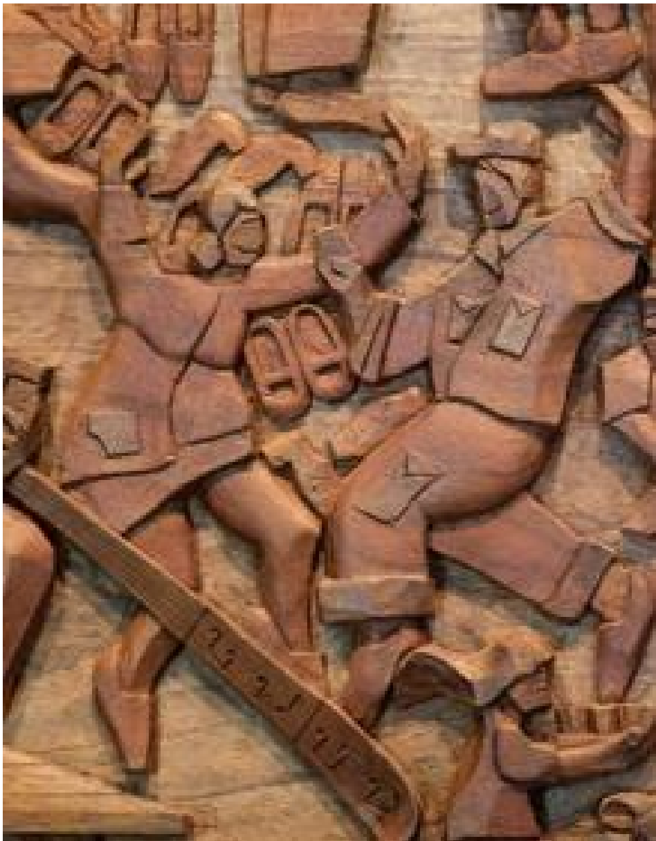
Oialumeko terraza, dantzaldiak hasi zirenean eta gaur egun. Azpian, aipatu muralaren detailea.