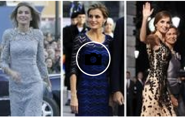
📷 La pasarela de doña Letizia en los Princesa de Asturias