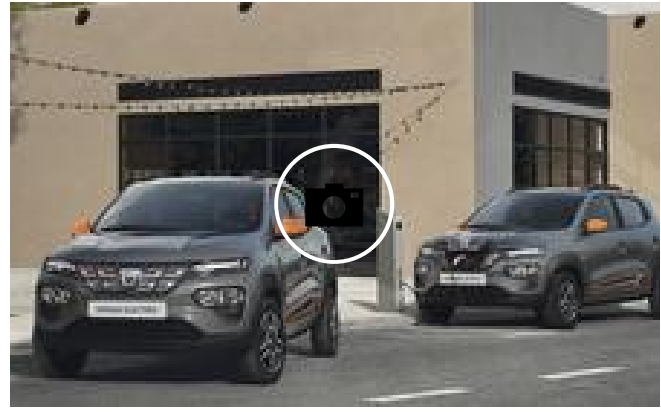
📷 Fotogalería: Spring, el primer eléctrico de Dacia