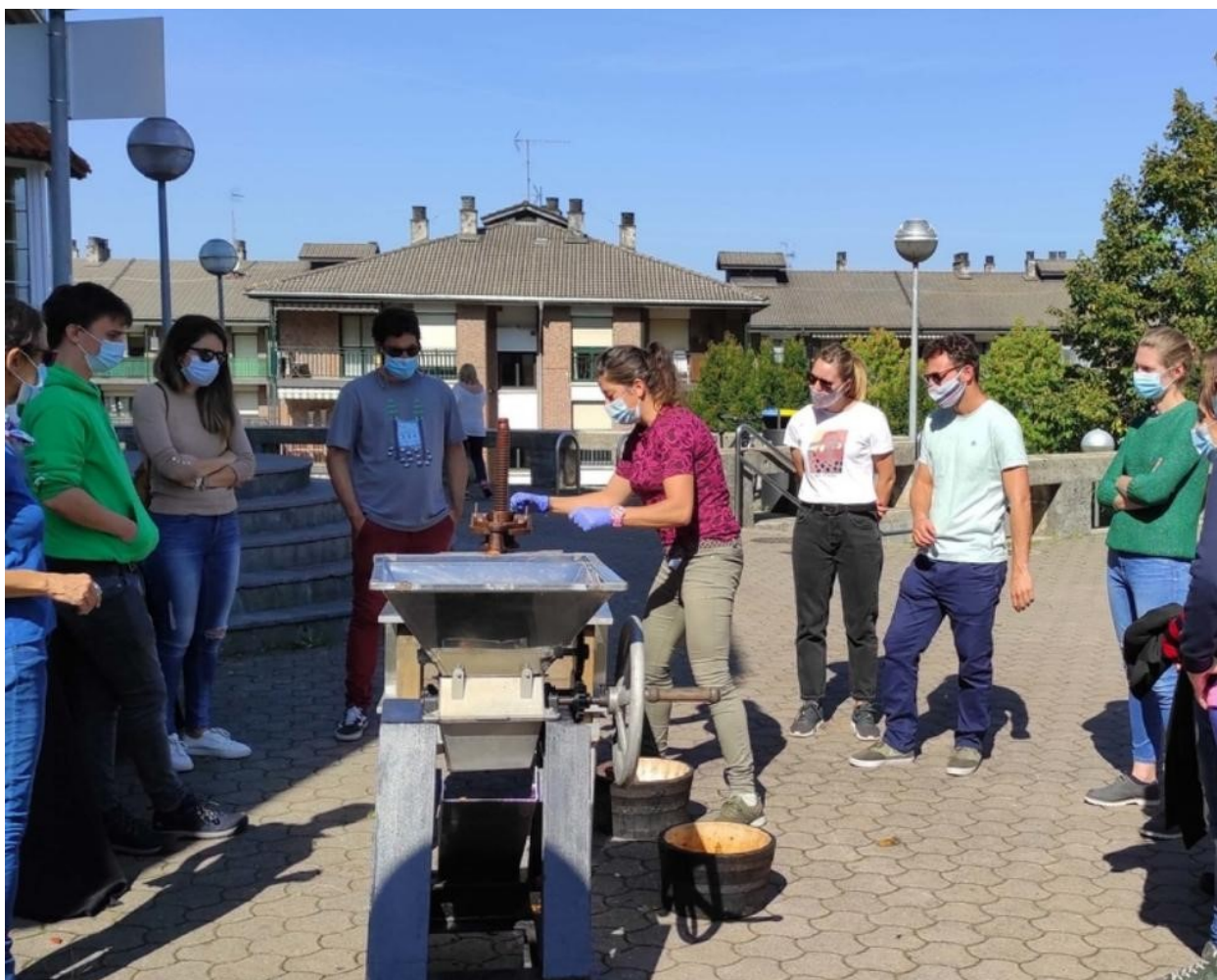
Trabajo con la manzana en el exterior del museo.

Udazken zaporez. Así se llama la iniciativa que el museo astigartarra ha dado a conocer a los agentes turísticos