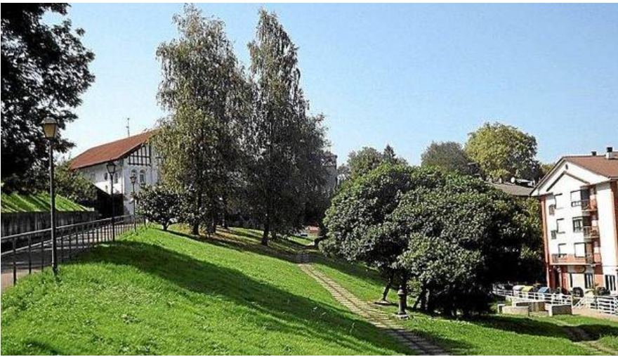
Parque en el que se ubica la Sagardoetxea actualmente.