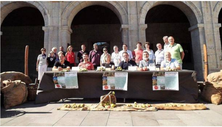
Representantes de Fruitel, Euskal Sagardoa, Sagardoaren Lurraldea, productores y la alcaldesa.

ASTIGARRAGA- Dentro de los actos de la XVIII Sagar Uzta que se celebra esta semana en Astigarraga, ayer se presentó el informe del estado de la maduración de la manzana de sidra de la cosecha de 2018 encargado por Fruitel y Sagardoaren Lurraldea.