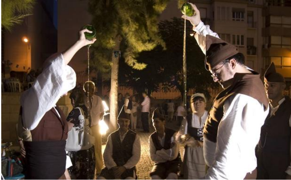
Celebración del Día de Asturias en Alicante.