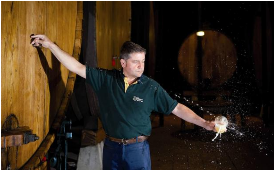
Producción de sidra en el lagar de Trabanco, Gijón, Asturias.