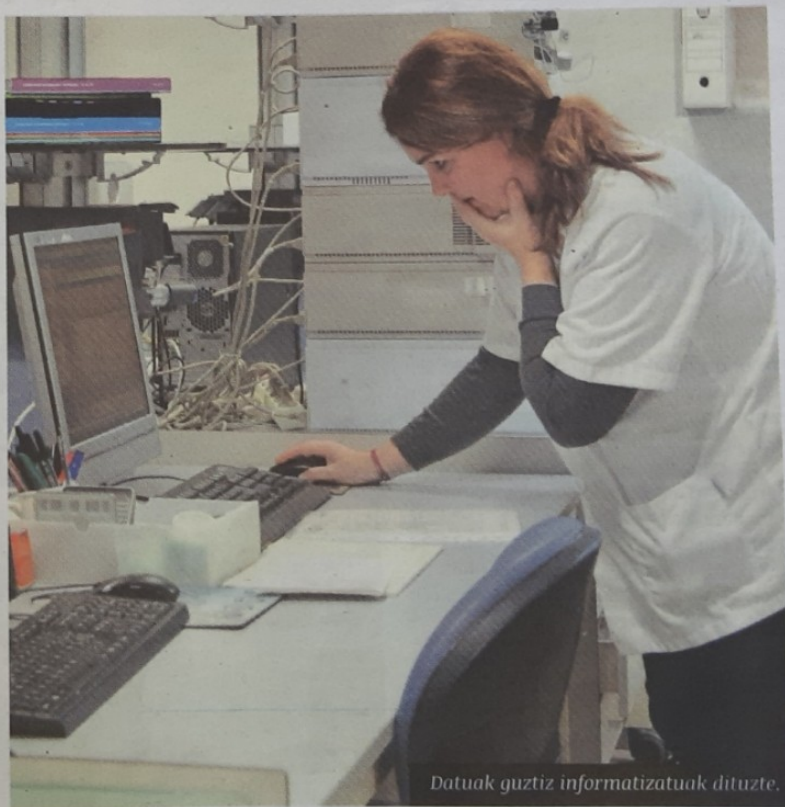
Datuak guztiz informatizatuak dituzte.

Bestalde, kontraste desberdinetan hartzen dute parte; lagin berdinetik parametro ber- dinak konparatzen dituzte laborategi desber- dinetan; «berez, denek berdina eman behar dute». Azken finean, «gure burua eta lana neurtzeko» balio dute konparazio hauek.