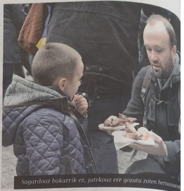
Sagardoaz bakarrik ez, jatekoaz ere gozatu zuten hernaniarrek.