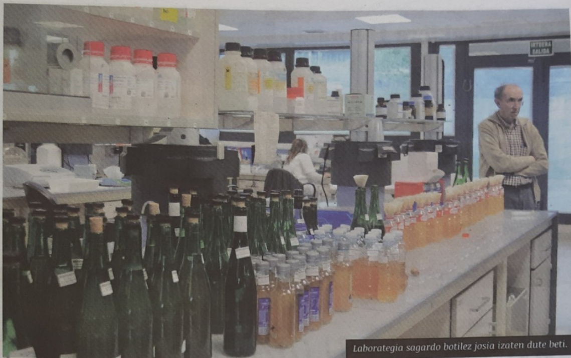
Laborategia sagardo botilez josia izaten dute beti.

«...alde, lagina aurkezteko momentua ...ko aldatzen da batetik bestera: ...prozesu osoan zehar jarraipena ...dute, sagarretatik hasi eta botiletan ...sagardora arte; beste batzuk, aldiz, ...egoeratik ekartzen dute...». Azke- ...bakoitzaren beharretara» egokitzen ...diote, «bakoitzak bere lan egiteko era ...inako» dituelako.