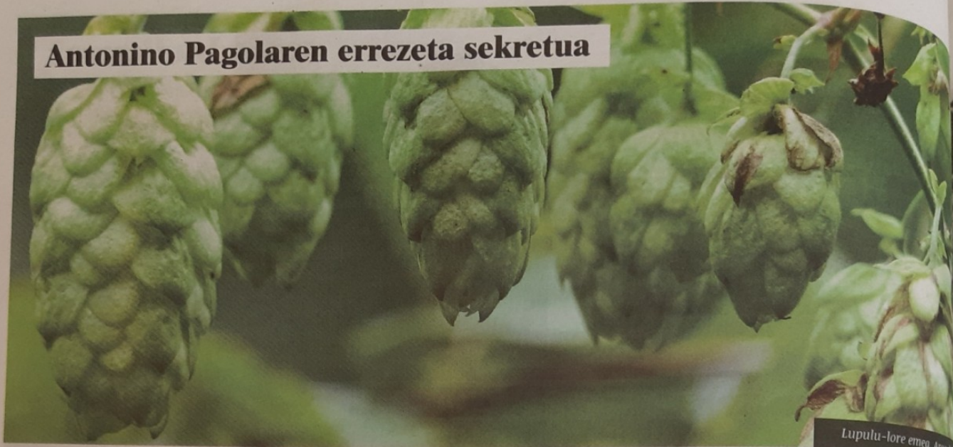
Lupulu-lore emea. Argi...