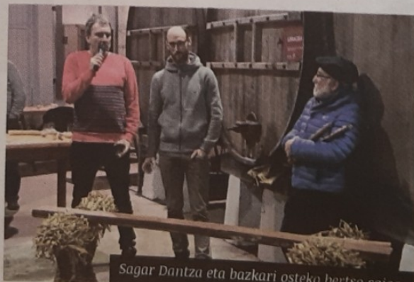
Sagar Dantza eta bazkari osteko bertso saioa.