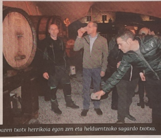
Txikientzako muztioaren txotx herrikoia egon zen eta helduentzako sagardo txotxa.