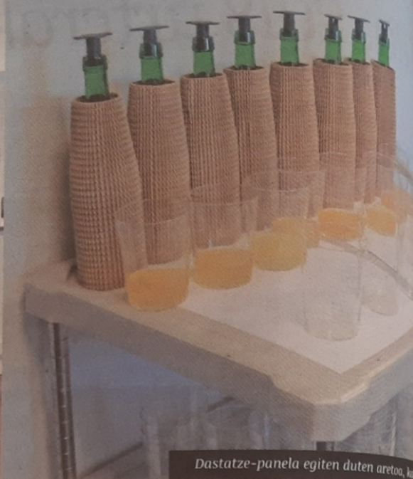
Dastatze-panela egiten duten aretoa, katal...