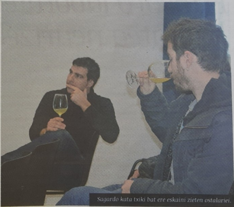
Sagardo kata txiki bat ere eskaini zieten ostalariei.

Eta ostalariren batek beraiekin harremanetan jarri nahi badu, hiru aukera: 688 645 946 telefonora deitu, do.euskalsagardoa@gmail.com helbidera idatzi, edo www.euskalsagardoa.eus web orrian.