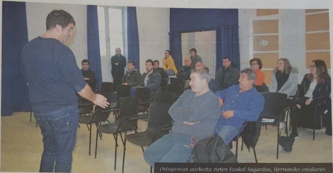
Ostegunean aurkeztu zieten Euskal Sagardoa, Hernaniko ostalariei.

Ondoren, aurkeztu zizkien dauzkaten produktu edo elementuak: arbelak, botilak, etiketak, pegatinak, kamara txikiak, eta zizkiadoreak... Eta kata txiki bat ere