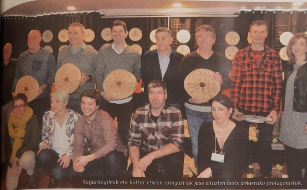
Sagardogileak eta kultur etxean oroigarriak jaso zituzten txotx irekierako protagonistak.

Aurreko urtean lehen aldiz txotx herrikoia irekieraren ibilbidea hasi zen, betiko txotx irekiera entzuten jarraipena emateko. Herritarrek ere parte hartzeko modua bilatu nahi zen eta hortik sortu zuen Udalak sagardogileen laguntza-erkin.