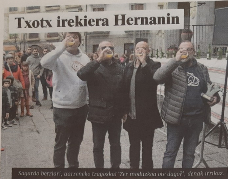
Sagardo berriari, aurreneko tragoxka! "Zer moduzkoa ote dago?", denak irrikaz.