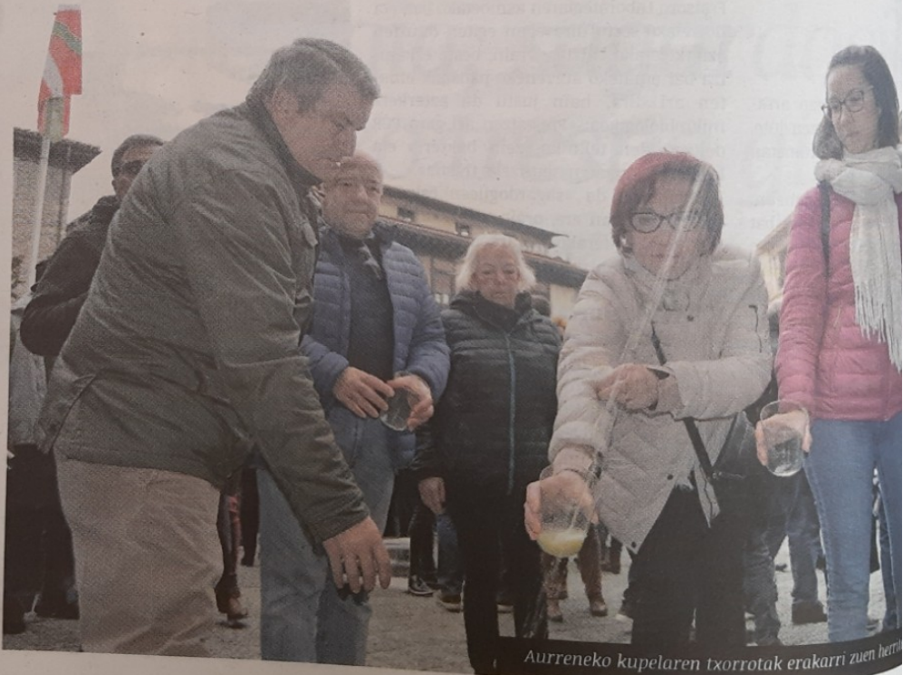
Aurreneko kupelaren txorrotak erakarri zuen hernaniarrek.

Baina 13:00etarako, Plaza hartu zuten txoko bakar, irekiera ekitaldirako. Zaporeak proiektua omendu, Wukrori eta Greziako errefuxiatuei elkartasun hitzak helarazi, eta aurreneko kupela ireki zuten. Hortik aurrera, sagardo berriaren txinparta dizdiratsusak hartu zuen protagonismoa.