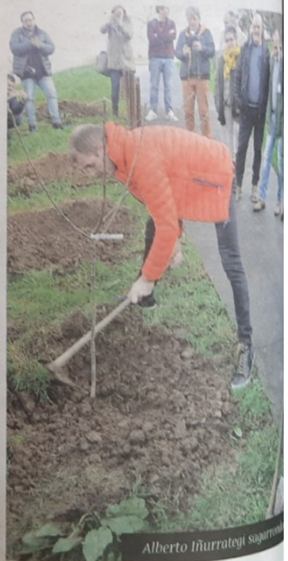
Alberto Iñurrategi sagardotegia