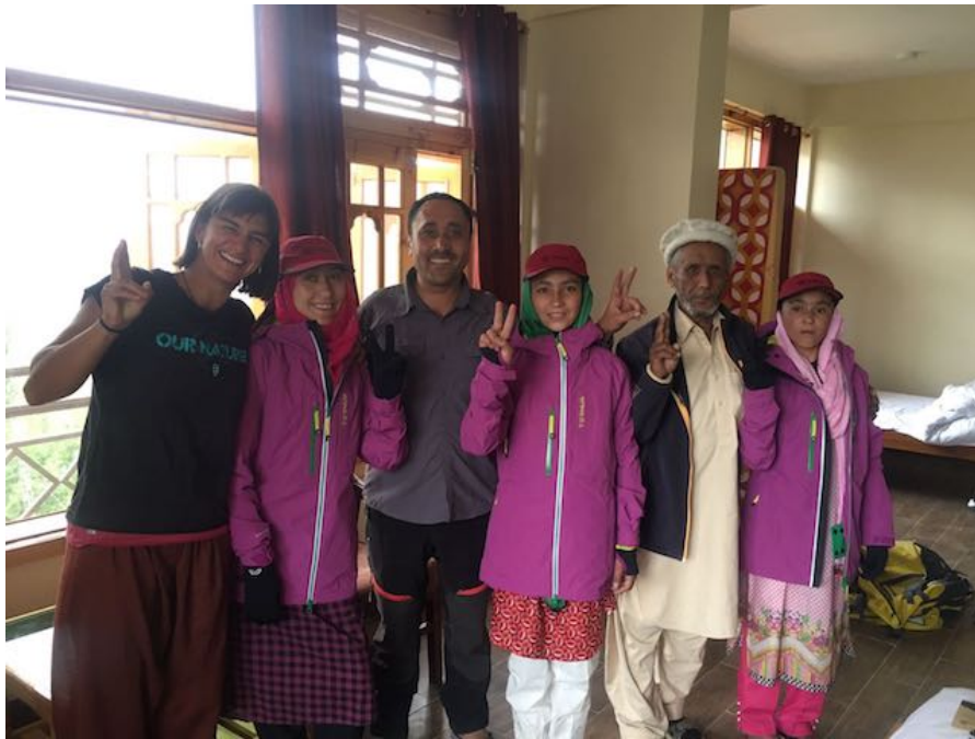
Ternua viste a chicas pakistaníes porteadoras en favor de la igualdad de género