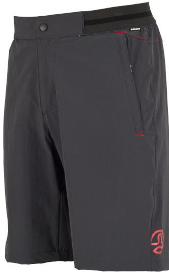
Ternua fabrica pantalones con redes de pesca