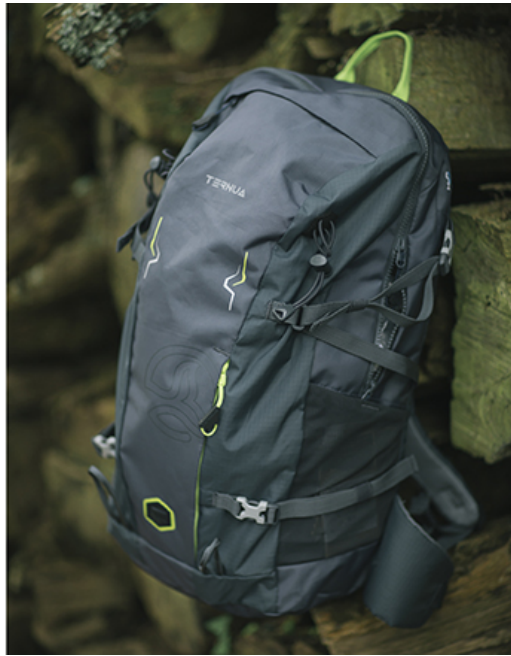
Ternua también apuesta por el reciclaje en sus accesorios