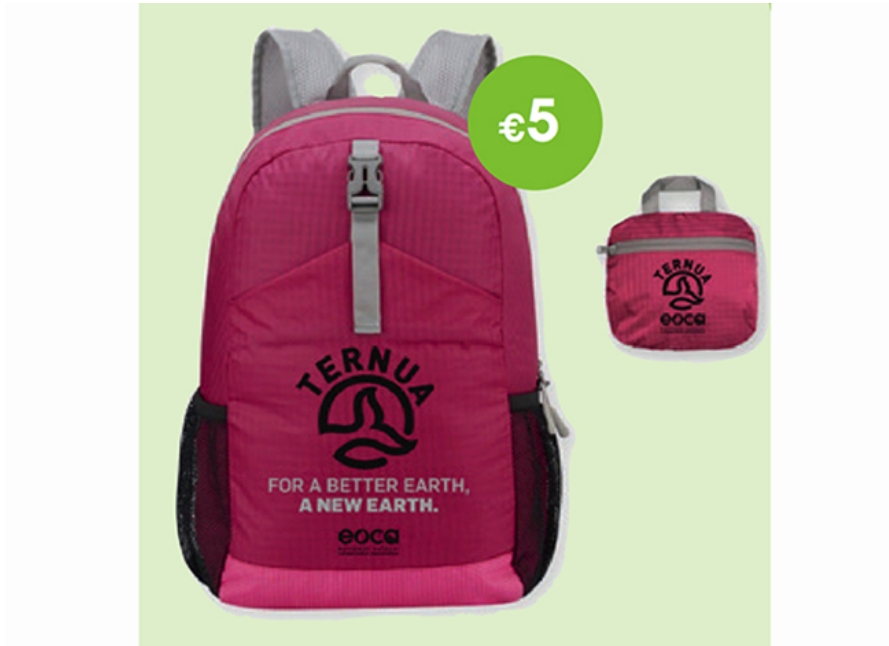
Ternua colabora en la replantación de 1.875 árboles en Nepal