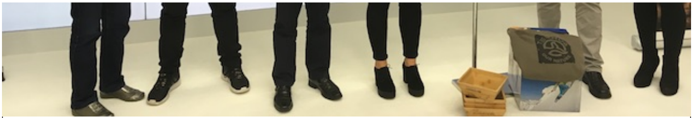
Imagen de presentación del nuevo proyecto de Ternua para tintar de forma natural sus prendas a través de cáscaras de nueces.

(30-5-2018). Ternua continúa dando pasos en su carrera en favor de la sostenibilidad, con la presentación en la Diputación Foral de Gipuzkoa de su proyecto de reutilización de cáscaras de nueces para elaborar tintes naturales.