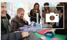
📺 Taller de reciclaje textil