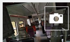
📺 Muere un hombre al descarrilar un tren de cercanías en Barcelona y salir disparado del vagón