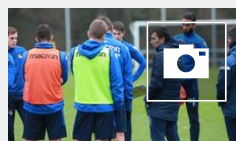
📺 Entrenamiento de la Real en Zubieta