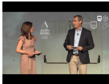
'FutureNi.eus': zahartzaroari begira herritarrek ...