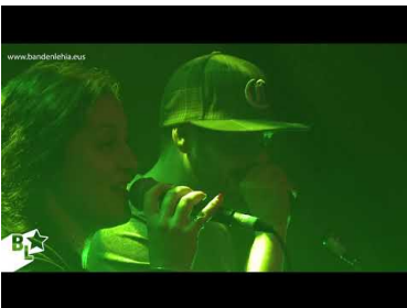
Musika taldeek izena eman ...