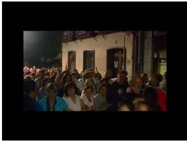
Agur San Joanei 2018