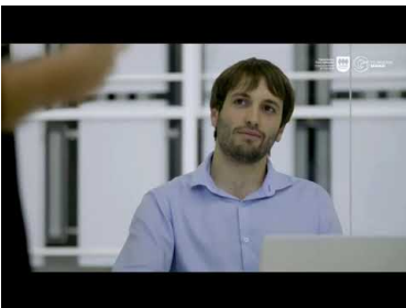
Elektromugikortasun Zentroa martxan, 2021erako