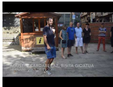
«Hernaniarrak harritu egiten dira; ...