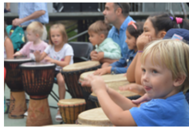
Auzo Eguna - Latsunbe...