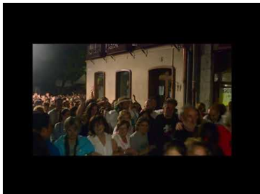
Agur San Joanei 2018