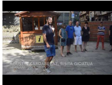
«Hernaniarrak harritu egiten dira; ...