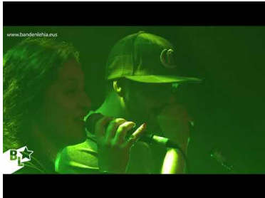
Musika taldeek izena eman ...