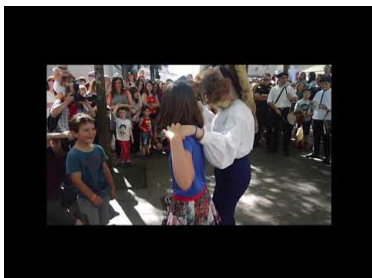
Gazteen Axeri dantza 2018