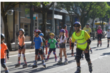
Mugikortasun astea 2018