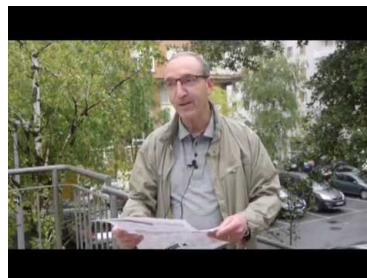
Memoria gorde, oraina bizi, ...