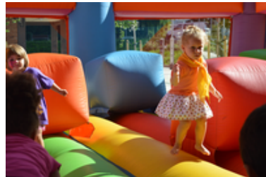
Karabel eguna 2018