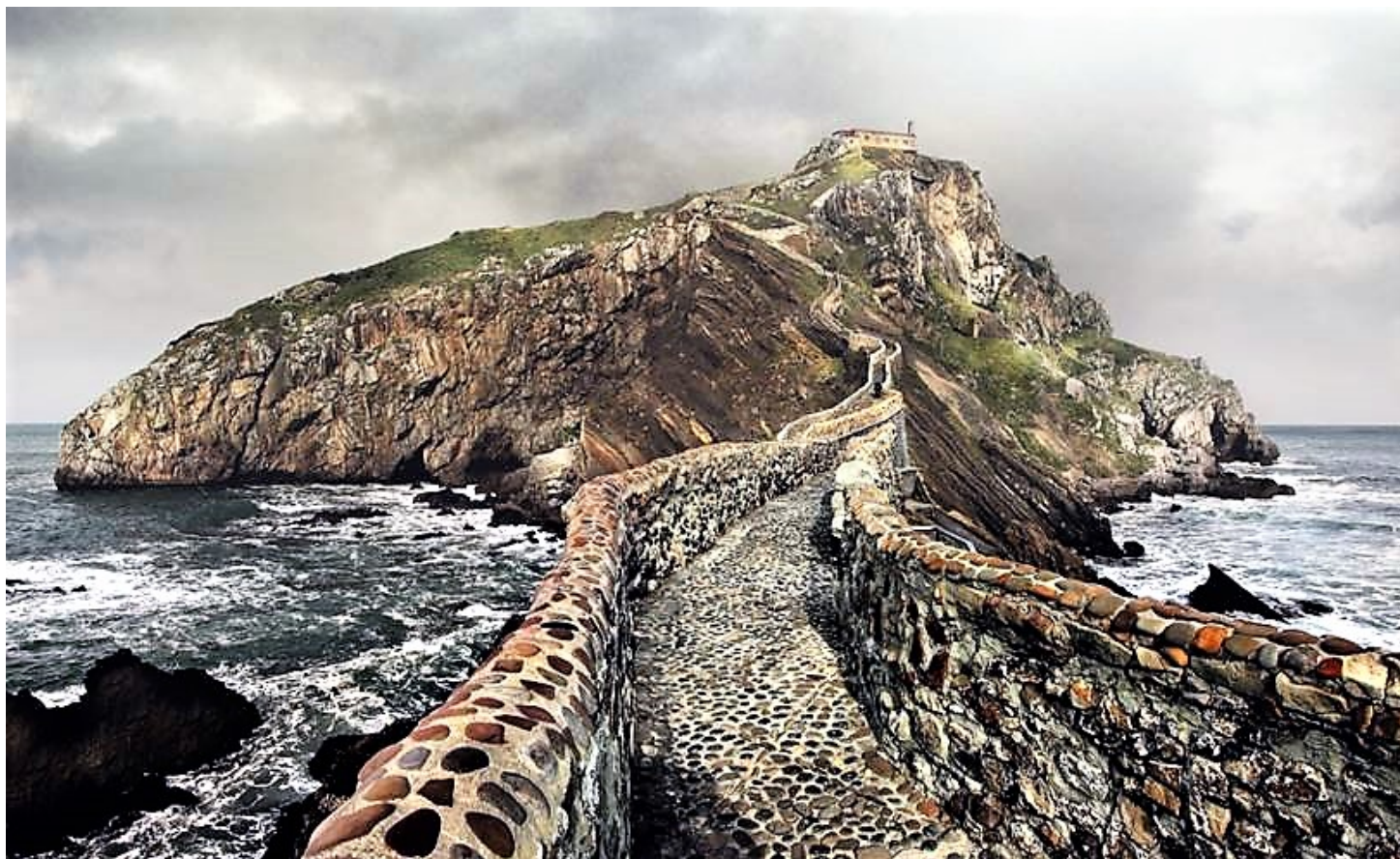
El rodaje de la serie Juego de Tronos (2016) en el islote de San Juan de Gaztelugatxe dio publicidad mundial a este espectacular lugar que se ha convertido en uno de los puntos de interés más visitados del País Vasco.

Una opción interesante es viajar a través del aeropuerto de Bilbao con muchas rutas domésticas e internacionales. Es el más importante del norte de España y está situado en Loiu, a tan solo 10 kilómetros de la capital. Si quieres disfrutar de una escapada larga de fin de semana te recomendamos que viajes jueves por la tarde para aprovechar al máximo tu viaje. En el aeropuerto puedes alquilar un automóvil para poderte desplazar con mayor facilidad. No olvides de llevar contigo unas buenas zapatillas, un chubasquero, un paraguas, una cámara fotográfica, tu smartphone y tus medicamentos si los necesitas.