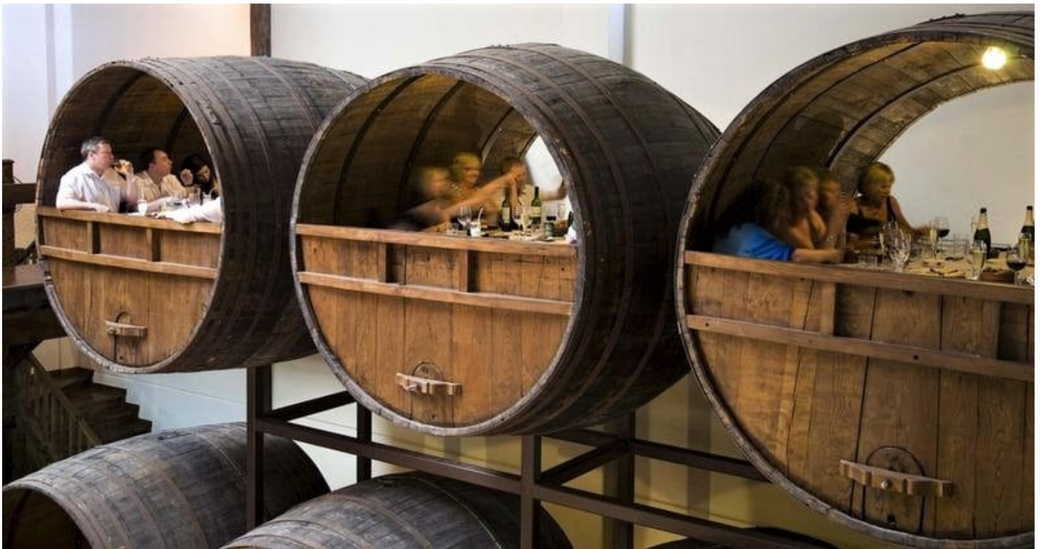
Las originales 'kupelas' -barricas- de la sidrería Iretza Sagardotegia en el pueblo de Astigarragat.

Para acceder a la cumbre se debe hacer caminando por un estrecho y zizageante puente compuesto por 241 peldaños. Este espectacular y mágico lugar desde que fue elegido como uno de los escenarios de la séptima temporada de Juego de Tronos, ha multiplicado la afluencia de turistas. Para evitar la masificación la Diputación Foral de Bizkaia se ha visto obligada a poner un sistema de control – tickets vía web – de reserva previa. La entrada es gratuita, pero evita las colas y permite una visita más intensa y enriquecedora para el visitante.