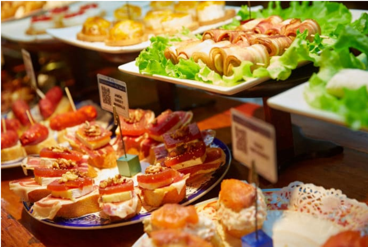
La cultura del pintxo es la seña de identidad de la gastronomía vasca.

Más adelante, se halla el centro comercial Zubiarte -compras, gastronomía y salas de cine- situado junto al puente de Deusto, entre El Museo Guggenheim, La Torre Iberdrola y el Palacio Euskalduna, las grandes referencias arquitectónicas del nuevo Bilbao.