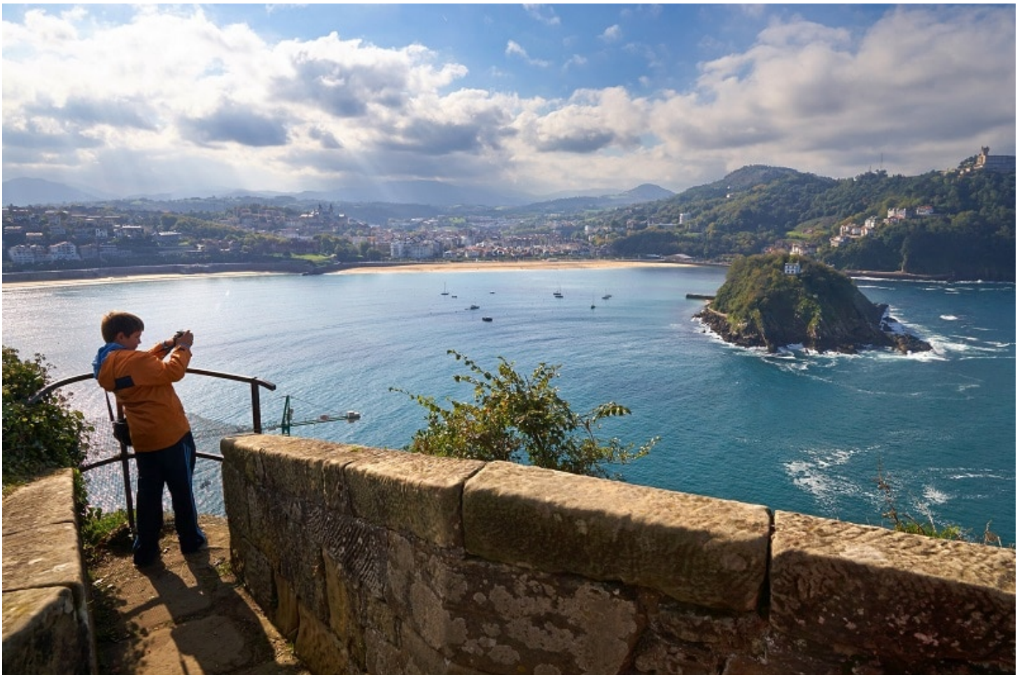
La bahía de San Sebastián.

La jornada se puede acabar con una puesta de sol sobre el Monte Igueldo que se alza en el extremo de la Bahía de La Concha, marcando el límite entre el mar y la ciudad. Lo más recomendable es acceder a la cima a través del funicular y sentado en sus vagones de madera. Este medio de transporte fue inaugurado en 1912 y subía a los ciudadanos de San Sebastián al casino, al salón de bailes y al parque de atracciones que todavía sigue funcionando. En el precio – adultos 3,15 € y niños 2,35€ -se incluye entrada al recinto panorámico.